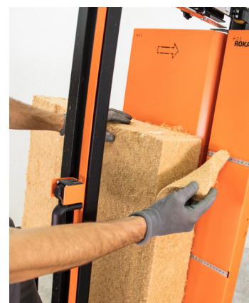
Auch für Holzfaserdämmplatten geeignet (mit Sonderzubehör)