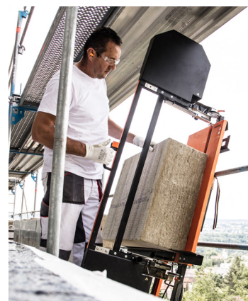
Perfekt für Arbeiten auf dem Gerüst