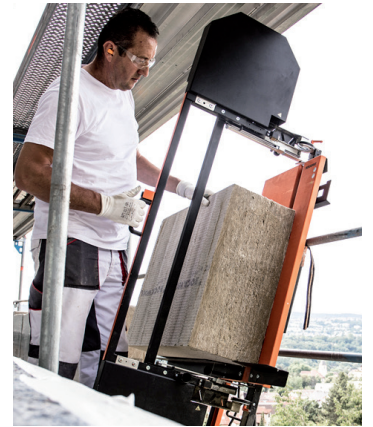
Perfekt für Arbeiten auf dem Gerüst