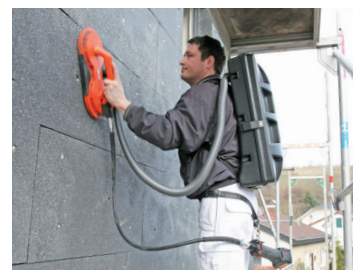
RVC C kombiniert mit dem Akku-WDVS-Schleifer Fox