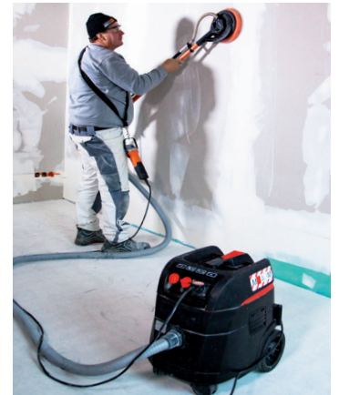
Kombinierbar mit allen Rokamat Schleifmaschinen