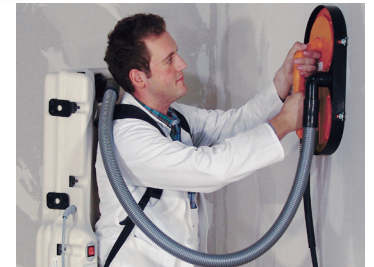
Rucksacksauger kombiniert mit CHAMELEON